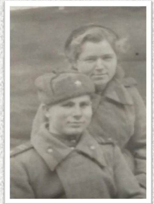
Фото сделано в конце войны, 4 мая 1945 года. Город Дрогобыч, Чехословакия.

- Шошина Татьяна, физическая культура и спорт, 2 курс, волейбол